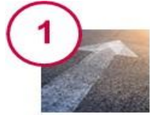
Engagement de la Direction